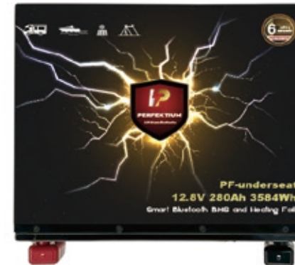
PF Underseat 12.8V-280Ah (mit Heizung)