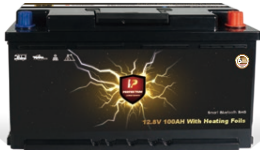
PF Underseat 12.8V-100Ah (mit Heizung)