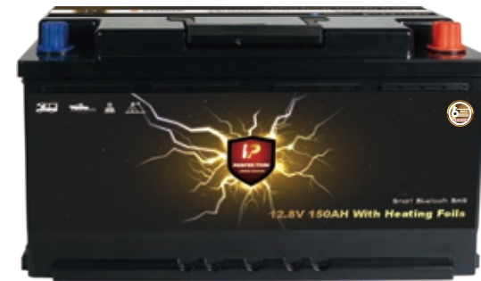
PF Underseat 12.8V-150Ah (mit Heizung)