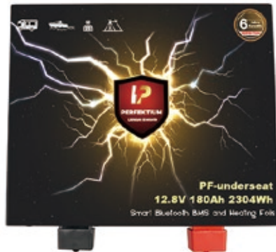
PF Underseat 12.8V-180Ah (mit Heizung)